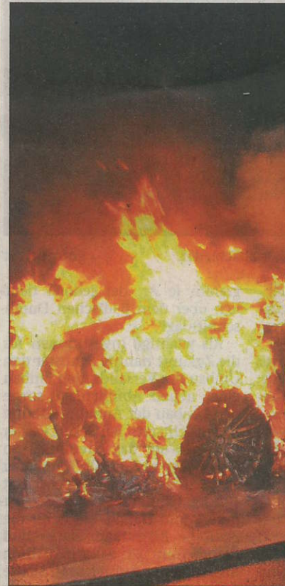
In hellen Flammen stand ein Pkw am ve

reich Leutersberg ein Fahrzeug von der Straße abgekommen und auf dem Gleisbett der Deutschen Bahn AG zum Stehen gekommen.